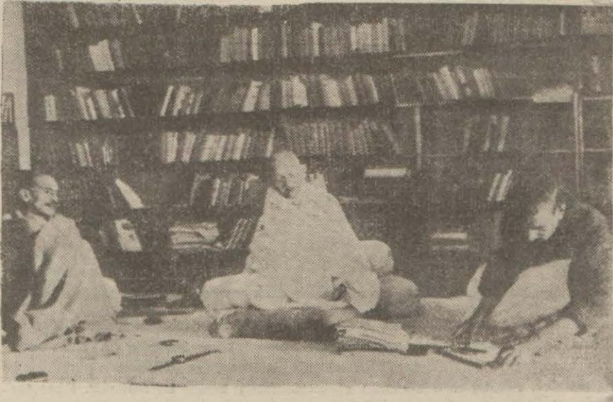
Gandi, kütüphanesinde mi'li kongre kâtiplerine bir kararı dikte ettiriyor

Bu sabahki Sovyet tebliği Moskova, 4 (A.A.) — Bu sabahki Sovyet resmî tebliği: Dün cephelede taarruzî muharebe devam etmiş ve bir takım meskün mahaller geri alınmıştır.